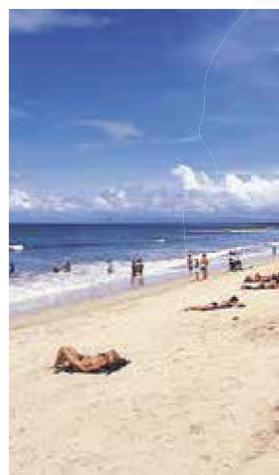
★ Kuta Beach

Aan deze smalle straat vindt men winkels, kraampjes, restaurants en voordelige accommodatie.