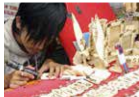
Ambachtsman aan het werk in een van de vele kraampjes

Kuta is de belangrijkste toeristenbestemming van Bali. Veertig jaar geleden lagen er palmbossen en bananenplantages langs het strand. Het is nog altijd een belangrijke attractie, maar nu vindt men er bars, restaurants, hotels, nachtclubs, warenhuizen en andere voorzieningen voor toeristen. Dicht opeen in de smalle straten verkopen kleine winkels en kraampjes zaken die toeristen uit de hele wereld aanspreken, en er zijn losmen , waar men terecht kan voor goedkoop onderdak (blz. 170). Hoe commercieel Kuta nu ook moge zijn, het is een levendige plek voor elk budget.