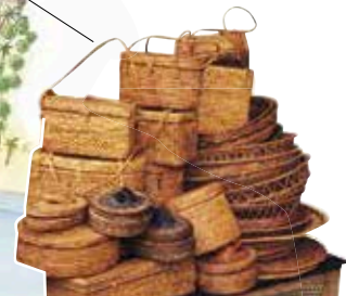
Kuta Art Market

Hier zijn manden en andere zaken te koop die op Bali en de nabije eilanden van de Indonesische archipel gemaakt worden.