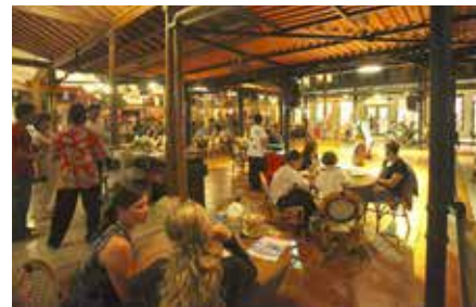
Made's Warung I

Een van Kuta's eerste en bekendste restaurants serveert lokale en internationale gerechten (blz. 182).