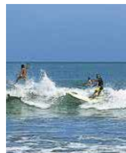
Surfers bij Kuta, een geschikte locatie voor alle vaardigheidsniveaus