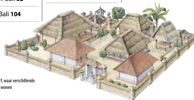
Een Balinees woonerf, waar verschillende generaties bij elkaar wonen