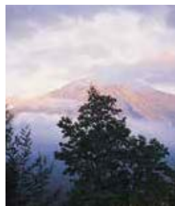
De hellingen van Gunung Batur in Oost-Bali doemen op tussen de wolken