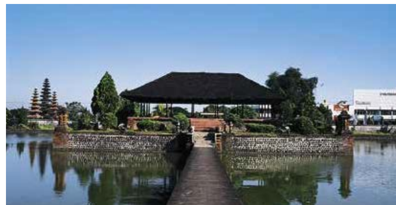
Mayura-waterpaleis in Mataram, gebouwd in 1844, met op de achtergrond Pura Meru