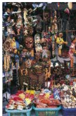
Winkel in Jalan Legian met traditionele Balinese handwerkproducten