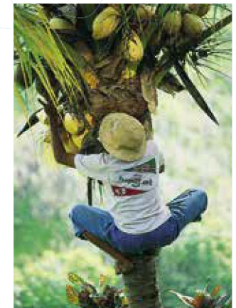
Kokosnoten verzamelen bij Ubud

Verklaring van de symbolen zie achterflap