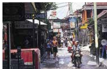
★ Poppies Lane II

Een van Kuta's eerste en bekendste restaurants serveert lokale en internationale gerechten (blz. 182).