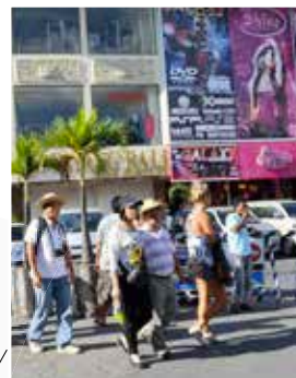
★ Kuta Square

Dit is een belangrijk winkelcentrum met honderden kleine winkels, het grote Matahari-warenhuis en de Kuta Galleria (blz. 191).