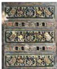
Paneel van bewerkt hout

Het dorp Tenganan (blz. 114–115) staat bekend om de gravures op de bladeren van de lontarpalm.