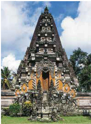
Pura Pengastulan, een tempel in Bedulu

Midden-Bali is beroemd om zijn handwerk en zijn (dans)theater. Ubud is een belangrijk artistiek centrum en een goede uitvalsbasis voor het verkennen van de streek. Er liggen veel andere historische dorpen en monumenten langs de wegen tussen de kustvlakte en de hellingen van de Gunung Batur. De rivierkloven, die door heuvelruggen en rijstterrassen van elkaar gescheiden zijn, vormen fraaie landschappen waar het goed wildwatervaren is. Vlak bij Singapadu liggen het aantrekkelijk aangelegde Bali Vogelpark en het Bali Reptielenpark.