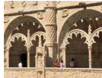
★ Kloostergang De bouw in manuelstijl door João de Castilho werd voltooid in 1544. De bogen en balustraden zijn versierd met verfijnd maaswerk.