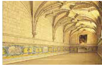
Refectorium De muren van het refectorium zijn bedekt met 18de-eeuwse azulejos , en met een paneel van de Spijziging van de Vijfduizend.

Schip Het spectaculaire gewelf van de Santa Mariakerk wordt geschaagd door ranke pilaren. Ze reiken tot het plafond en verschaffen ruimtelijkheid en harmonie.