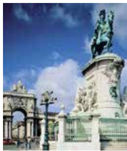
① Ruitersstandbeeld van José I op de Praça do Comércio

Deze wandeling neemt u mee van de laat-18de-eeuwse grandeur van de Baixa, naar de stegen van Alfama, een veel oudere en nederiger buurt. Het Castelo de São Jorge bekroont de heuvel op een plek die al duizenden jaren gefortificeerd is. Daarachter ligt Mouraria, de wijk waarnaar toe de overgebleven Moren werden verbannen nadat Afonso Henriques in 1147 de stad had veroverd. Men gelooft dat hun erfgoed overleeft in de stembuigingen van de fado , die hier het meest authentiek is.