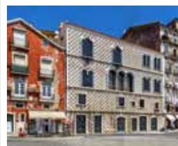
④ Opvallende Casa dos Bicos op Rua dos Bacalhoeiros