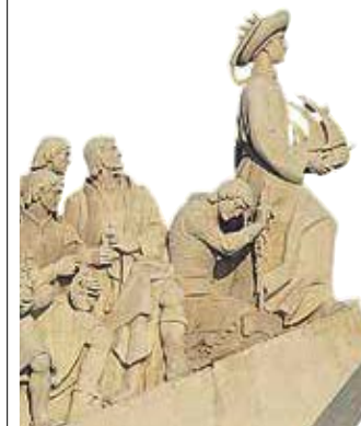
Het Monument der Ontdekkingen