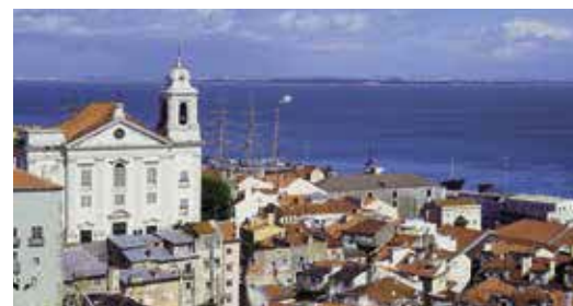
Schitterend uitzicht over de daken van Alfama

het plein is het Museu de Artes Decorativas ⑫ (blz. 36). Zoek Beco do Maldonado aan de andere kant van het plein en beklim de treden tot u rechtsaf kunt Pátio de Dom Fradique ⑬ in. Loop van Rua do Chão da Feira af, de hoofdingang van het Castelo de São Jorge (blz. 40–41). In een hoek hier staat een urinoir met een smeedijzeren versiering ⑭ die het tot een veel gefotografeerd kunstwerk maakt. In een nis in de poort naar de citadel staat een beeld van Sint-Joris ⑮.