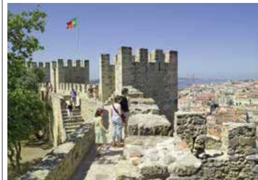
Uitzicht vanaf de kantelen van het Castelo de São Jorge

Volg de hoek van 45 graden naar rechts bij Beco das Cruzes en loop verder naar Calçadinha de São Miguel ⑩. Ga hier onder de nauwe boog door het Escadinhas de São Miguel op. Ga dan rechts en klim de Beco da Corvinha op, onder een andere boog door naar Rua Norberto Araújo. Ga rechtsaf en volg de straat de treden op en de hoek om naar Largo das Portas do Sol met het beeld van de patroonheilige van de stad, São Vicente ⑩. Aan de overkant van