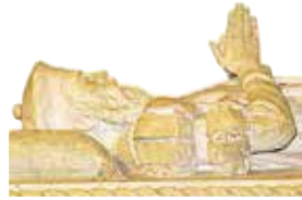
Graf van Vasco da Gama Het graf van de zeevaarder (blz. 70) is versierd met onder meer hemelglobes en zeevaartsymbolen.

Het klooster, dat de rijkdom in het tijdperk van de ontdekkingsreizen (blz. 22–23) weerspiegelt, is het hoogtepunt van de manuelarchitectuur. Manuel I gaf rond 1501, vlak na Vasco da Gama's terugkeer van zijn historische reis, opdracht tot de bouw, die met 'pepergeld' werd bekostigd; een heffing op kruiden, edelstenen en goud. Grote architecten werkten aan de opdracht, onder wie Diogo Boitac, in 1517 opgevolgd door João de Castilho. Het klooster werd tot 1834 bestuurd door de orde van de heilige Hiëronymus (hiëronymieten). In dat jaar werden de religieuze orden ontbonden.