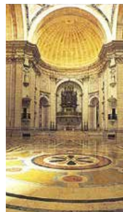
Het veelkleurige marmeren interieur en de koepel van de Santa Engrácia