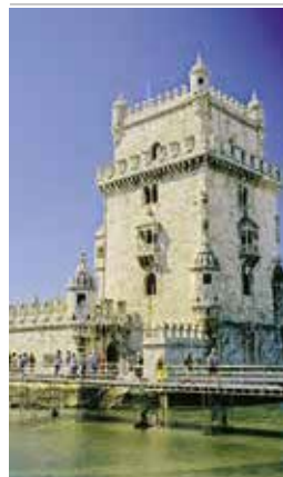
De Torre de Belém is een opvallend beeld in de stad