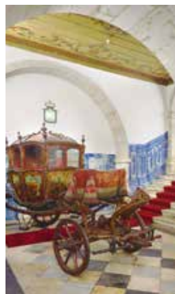
Rijtuig in de hal van het Museu de Artes Decorativas