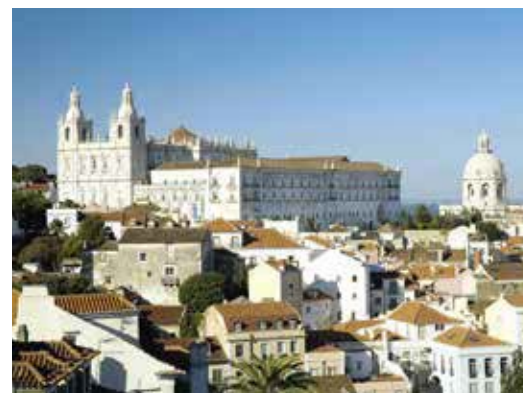
Zicht op São Vicente de Fora en de koepel van de Santa Engrácia