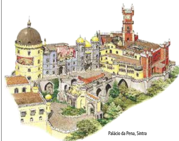
Palácio da Pena, Sintra