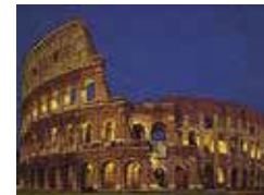
Colosseum Blz. 94–97.