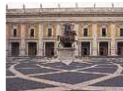
Capitolijnse Musea Blz. 70–73.