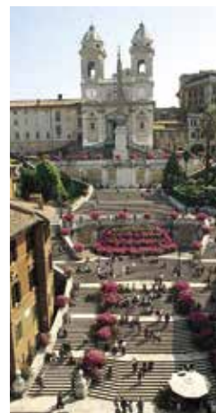
Spaanse Trappen Blz. 136.