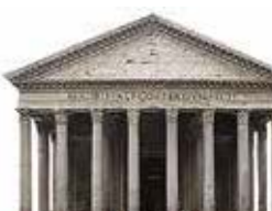
Pantheon Blz. 114–115.