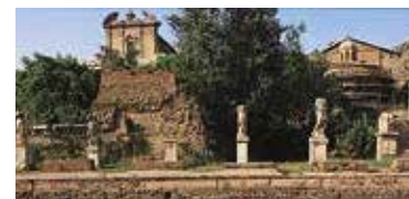
Forum Romanum Blz. 78–89.