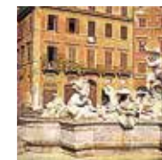
Piazza Navona Blz. 122.