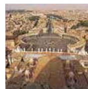
Sint-Pieter Blz. 228–231.