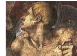
Sixtijnse Kapel Blz. 242–245.