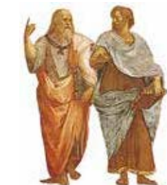
Stanze van Rafaël Blz. 240–241.