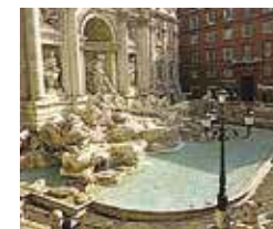
Trevifontein Blz. 161.