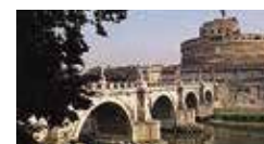
Engelenburch Blz. 250–251.