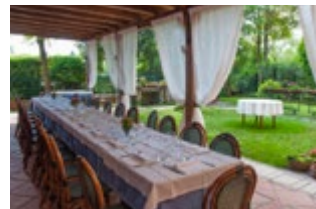
Antica Trattoria alla Maddalena

Kaart H1 ■ Fondamenta S Caterina 24, Mazzorbo ■ 041-730118 ■ Gesloten ma, 7 jan.-7 feb. ■ € Goedkoper dan in Burano. U kunt gnocchi met krab eten en in de herfst staat er wild op het menu.