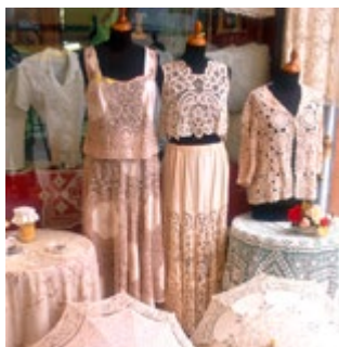
Lidia Merletti d'Arte

Kaart H1 ■ Via Galuppi 215, Burano Een prachtige winkel met kanten tafelkleden, handdoeken en matten. Achterin kunt u een 18de-eeuwse bruidsjapon, een kanten waaier van Lodewijk XIV en kanten altaarstukken bewonderen.