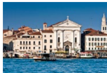
Santa Maria della Pietà

Deze kerk met zijn klassieke voorgevel is onlosmakelijk verbonden met de componist Antonio Vivaldi. Het godshuis was deel van het ernstig gevestigde weeshuis, waar Vivaldi muziekles gaf. Tijdens een van de avondconcerten kunt u hier een fraai plafondfresco van Tiepolo bewonderen, met een koor van jonge wezen, te herkennen aan de granaatappelbloesems. De koornissen in de kerk waren bedoeld voor zangers en edelen die zich niet onder het gewone volk plachten te begeven.