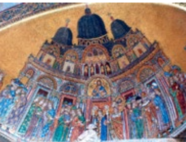
Mozaïek in de Basilica San Marco