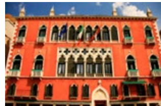
Opvallende gevel van Hotel Danieli