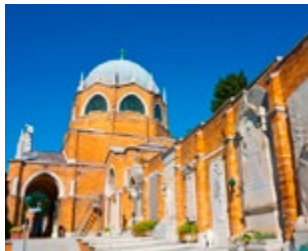
Begraafplaats Isola di San Michele

Op een eiland dat wordt omsloten door een hoge stenen muur en begroeid is met cipressen vindt u de monumentale begraafplaats van de stad (blz. 118). Zelfs als de graven van bijvoorbeeld Igor Stravinsky, Diaghilev of Joseph Brodsky u niet kunnen boeien, is het het een leuke plek om zomaar wat te wandelen.