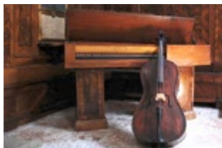
Museo della Musica

Dit fascinerende museum in een verbouwde kerk biedt gratis toegang. Bewonder de historische collectie bijzondere muziekinstrumenten die teruggaat tot aan de tijd van Vivaldi.