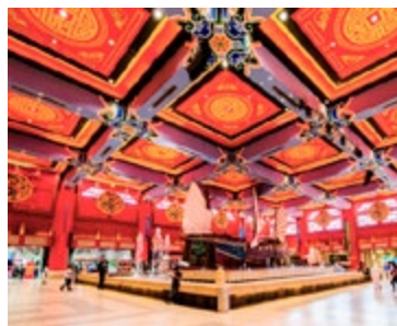
Exotische inrichting van Ibn Battuta

Zodra u de zes thematische centra en de food courts binnen dit winkelcentrum ziet, bent u de lange rit naar Emirates Hills vergeten. De inrichting van elk gebied is geïnspireerd door de landen waar de Arabische Marco Polo, Ibn Battuta, is geweest: Tunesië, Egypte, Perzië, India, Andalusië en China. Er is ook een bioscoop met 21 zalen (blz. 83).