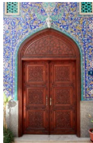
Deur van de Iraanse moskee

Kaart J1 In een steegje vlak bij de textielsoek (blz. 66) ligt de prachtige Iraanse moskee van Bur Dubai (verboden voor niet-moslims). Ook als u niet naar bin-