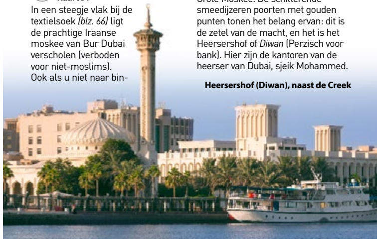
Heersershof (Diwan), naast de Creek

Kaart K2 ■ Naast Al Fahidi, aan de Creek Crèmekleurig gebouw met imposante windtorens aan de Creek, naast de Grote Moskee. De schitterende smeedijzeren poorten met gouden punten tonen het belang ervan: dit is de zetel van de macht, en het is het Heersershof of Diwan (Perzisch voor bank). Hier zijn de kantoren van de heerser van Dubai, sjeik Mohammed.