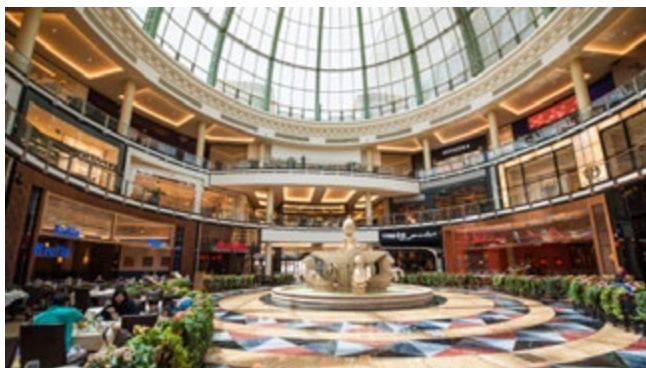
Mall of the Emirates, met een indrukwekkende glazen koepel

Ruim 520 winkels, waaronder een chique Harvey Nichols, maken dit tot het weelderigste winkelcentrum. Als u haast hebt, kunt u op de website van het centrum de meest directe route uitstippelen langs alle winkels die u wilt bezoeken (blz. 79).