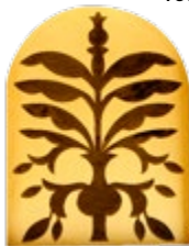
Paneel, Architectuur museum

Dit drukke deel van de stad staat vol met hotels, kantoorgebouwen en woonflats, maar een eeuw geleden was het hier een zandvlakte vol barasti (palmladerenhuisen) en windtoerenhuizen. De beste plek om een indruk van het oude Bur Dubai te krijgen is de historische wijk Al Fahidi, het vroegere Bastakiya, waar binnenplaatshuizen aan de Creek zijn gerestaureerd. Deze sfeervolle wijk is een vredige oase in de drukke en jachtigheid van de stad. Hier staat ook fort Al Fahidi, nu het Dubai Museum. In het erfgoedgebied Shindagha, direct aan de monding van de Creek, begon Dubais rol als ondernemende en kosmopolitische handelsstad. De soeks van Bur Dubai herinneren hier aan.