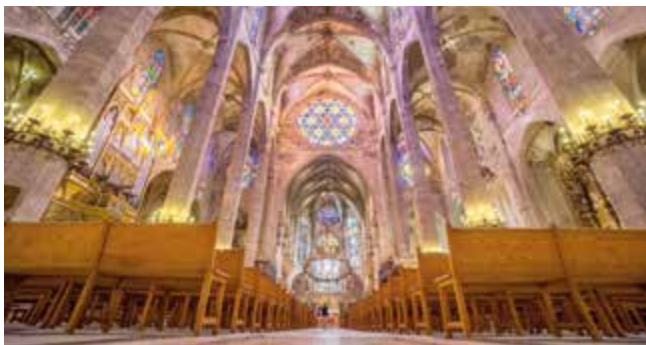
Het imposante schip en de gebrandschilderde ramen van La Seu