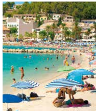
Badgasten bij Port del Sóller

Hoewel het bijna wordt opgeslokt door Cala d'Or (blz. 122) is dit vissersdorpje er tot nu toe in geslaagd om zijn authentieke sfeer te behouden – mogelijk omdat er geen strand is. U kunt er rondwandelen en de hellingen met villa's en de boten in het jachthaventje bewonderen. Er is slechts één hotel, dat een goede uitvalsbasis is om het eiland te verkennen.