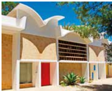
Fundació Pilar i Joan Miró, Palma

Miró had banden met Malloorca; zowel zijn moeder als zijn vrouw zijn hier geboren, en de grote kunstenaar bracht zijn laatste jaren hier door. Van zijn atelier in die laatste periode is nu een museum gemaakt dat gewijd is aan zijn werk ( blz. 18–19 ).