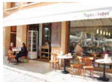
Terras van Café Plaça

Smul van lokale tapas, waaronder gefrituurde calamari of vers gegrilde pijnklivis, op het terras dat een prima plek vormt op het plein.