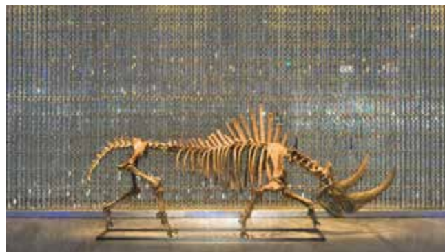
Expositie in het Fundación Yannick y Ben Jakober

Te midden van een mooie rozentuin en beeldenpark ziet u dit museum met eigentijdse kunst en koninklijke kindportretten uit de 16de–19de eeuw.