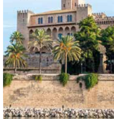
Palau de l'Almudaina

Kaart L4 ■ Place de la Seu ■ 971-214134 ■ Open di–zo 10.00–18.00 uur ■ Niet gratis Dit gebouw was ruim 1000 jaar een koninklijk paleis, en de stijl weerspiegelt de lange, moeilijke historie met een ongemakkelijke mix van Moors en gotisch (blz. 14–15).