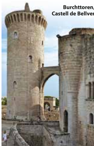
Burchtoren, Castell de Bellver