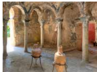
Het tepidarium in de Banys Àrabs

Kaart N5 ■ C/de la Portella 5 ■ 971-177838 ■ Open di–za 10.00–19.00, zo 10.00–14.00 uur ■ Niet gratis Het is de entree meer dan waard om het gebouw van binnen te zien, een 17de-eeuws paleis op de fundamente van een van de oudste Moorse huizen van Mallorca. Het boeiende museum geeft een beknopt overzicht van Mallorca van de prehistorie tot de 20ste eeuw. Behalve schatten uit de Romeinse tijd zijn er imposante reconstructies van tomben en woningen uit het neolithicum en de bronstijd. Er zijn ook prachtige exemplaren van modernistameubilair te zien – met name een console met een gewaagd asymmetrisch ontwerp (blz. 51).