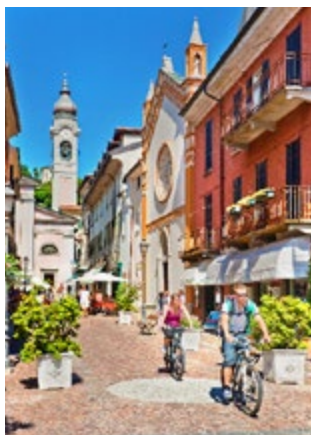
Fietsen rond Menaggio