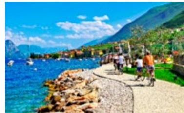
Fietspad rond Malcesine

Vanwege de tijdsloosheid van Franciacorta (blz. 32 en 86) is dit een prachtig gebied om per fiets te verkennen. Kies een route waarop u bij een paar wijnboerderijen kunt afstappen, of geniet van een maaltijd in een van de restaurants.