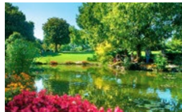
Parco Giardino Sigurtà

8 Parco Giardino Sigurtà, Valeggio sul Mincio Kaart R6 ■ Via Cavour 1 ■ 045-6371033 ■ Open maart–nov. dag. 9.00–19.00 uur ■ Niet gratis ■ www.sigurta.it In dit park vol oude bomen en gazons vindt u een grote variëteit aan bloemen, zoals tulpen en geurige hyacinten.