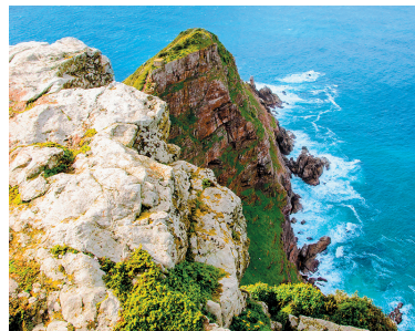
De kliffen bij Cape Point

Cape Point ligt op het zuidelijk uiteinde van de Cape Peninsula binnens Kaap de Goede Hoop ( blz. 32–33 ). Hij is te bereiken via een steil voetpad of een kabelbaan. U hebt er uitzicht op de kliffen en stranden en op de open zee, die zich zuidwaarts uitstrekt tot Antarctica.