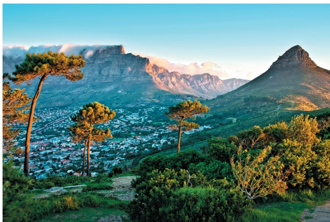
Zicht op Lion's Head en Kaapstad-centrum vanaf Signal Hill