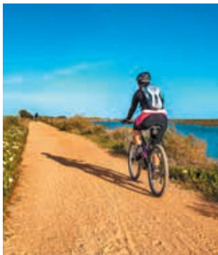
Fietsen in de buurt van Faro

De Algarve kunt u goed per (huur-) fiets verkennen. Lisa Bikes organiseert fietsroutes met of zonder gids, en diverse mountainbikeorganisaties bieden crosscountrytochten.