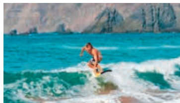
Surfen op de golven van de oceaan

De eerste grensoverschrijdende tokkelbaan ter wereld (720 m) voert tussen de dorpen Alcoutim ( blz. 91 ) in de Algarve en Sanlúcar in Spanje.