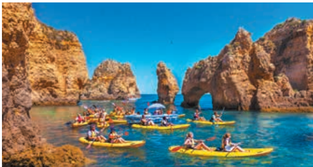
Kajakken bij de bijzondere rotsformaties van Praia da Piedade, Lagos