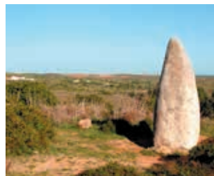
Menhir van Raposeira

Volg een gemarkeerde route langs 5000 jaar oude menhirs bij het dorp Vila do Bispo ( blz. 101 ).