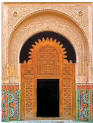
Houtsnijwerk op een deur