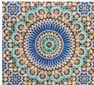
Kleurrijke zellij-terracotta tegels

Pisé , natte aarde vermengd met stro en steentjes, tussen twee planken geperst en verstevigd met kalk, is het meestvoorkomende bouw materiaal in Marokko. Als het niet goed is gemaakt, kan het mengsel bij regen ervoor zorgen dat een gebouw instort – Zuid-Marokko staat vol met halfvervalen gebouwen.